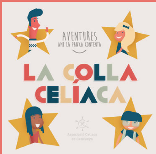
La colla celíaca