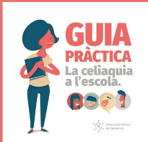
Guia pràctica: La celiàquia a l'escola