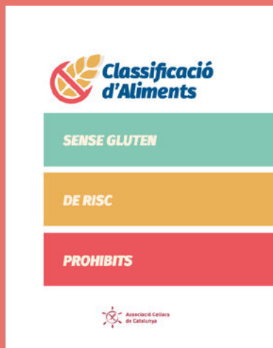
Guia d'aliments: sense gluten, de risc i prohibits