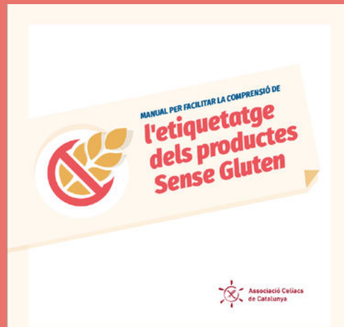
Manual per facilitar la comprensió de l'etiquetatge dels productes sense gluten