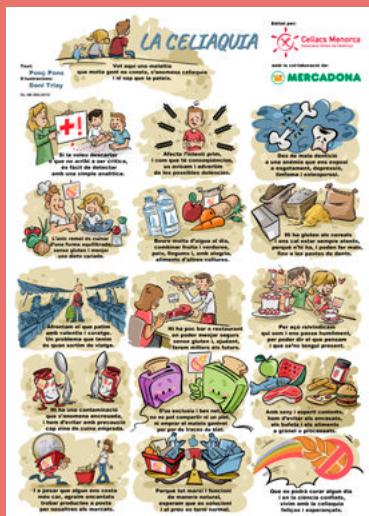
Auca "La Celiàquia"

Fes clic a les imatges per accedir als documents online.